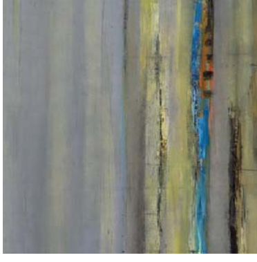
aus Rapsfeld-Birkenwald 110 x 230 cm Öl auf Leinwand

1956 geboren in Bremen 1977 -1983 Studium an der Hochschule der Künste, Berlin, Bildhauerei Meisterschülerin bei Joachim Schmettau 1984 Studium an der Hochschule der Künste, Berlin Kunsttherapie und Kulturpädagogik seit 1985 freischaffend als Malerin und Bildhauerin 1992 künstlerische Beteiligung am Deutschen Pavillon, EXPO '92 in Sevilla, Spanien 2005 Gründung des Kunstvereins „Kulturmühle Perwenitz e.V.“ Künstlerische Leitung im Bundesprojekt „2. Chance - Schulverweigerung“ Ausstellungen, Projekte und Stipendien im In- und Ausland lebt und arbeitet im Havelland