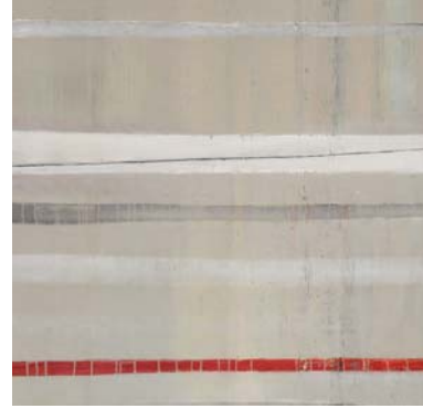
Zwischen Birken 140 x 140 cm Öl auf Leinwand