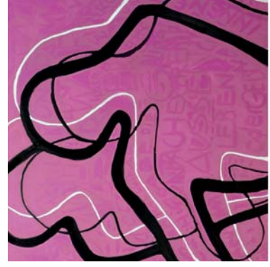
Lust aus Trilogie Maxi Wander 100 x 100 cm Acryl auf Leinwand