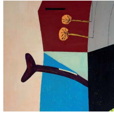
Landschaft mit Palmen 130 x 150 cm Öl auf Leinwand, 2009