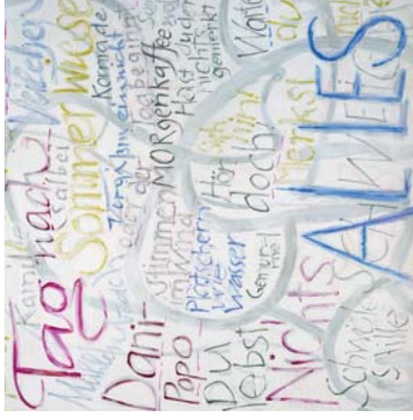
Alles aus Trilogie Maxi Wander 100 x 100 cm Acryl auf Leinwand

1940 geboren in Pölitz bei Stettin 1963 -1967 Studium an der FH für Angewandte Kunst Berlin, Diplom (FH) 1972-1991 freischaffend als Grafikerin, Designerin und Malerin seit 1990 Beteiligung an Kunstprojekten 1980 -1990 Mitglied des Verbandes Bildender Künstler (VBK) der DDR seit 1990 Mitglied des Brandenburgischen Verbandes Bildender Künstler (BVBK) und des (BBK) seit 1991 Beteiligung an Kunstprojekten 1991 -2003 Lehrtätigkeit an der Musik- und Kunstschule HVL seit 2003 freischaffend als Malerin und Grafikerin, Dozentin an der Musik-, Kunst- und Volkshochschule Havelland seit 1967 Ausstellungen und Beteiligungen im In- und Ausland lebt und arbeitet im Havelland