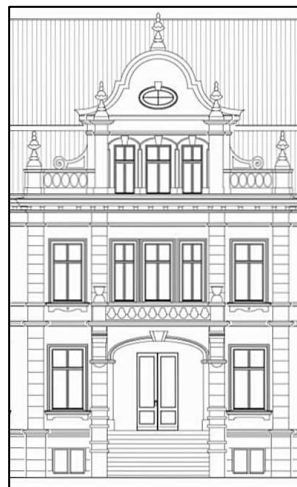
Schloss Ribbeck, Ostseite mit geschweiftem Giebel und Balkon nach 1893, Zeichnung nach Architekturbüro Fleege + Oeser / Brandenburg a. d. Havel, 2006.

einspringendes Treppenhaus. – Schloss Ribbeck hatte ursprünglich also einen asymmetrischen Grundriss. 1943 musste die Familie von Ribbeck ihr Anwesen, das im weiteren Kriegsverlauf nicht zerstört und das von einer Luftwaffeneinheit bezogen worden war, verlassen.