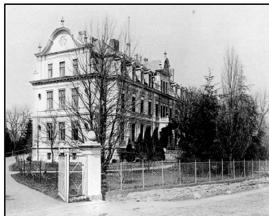
Schloss Ribbeck, eingezogener Südgiebel, vor 1900

Hans Georg Hennig von Ribbeck veränderte das Gebäude 1893 zu dem heutigen Schloss mit neubarocken Formen: Einen zweigeschossigen Putzbau über hohem Sockelgeschoss mit ausgebautem Mansarddach und Schiefereindeckung. Zwischen