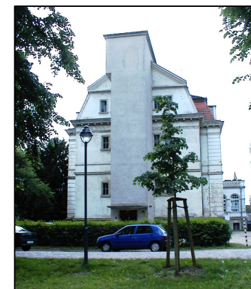
Schloss Ribbeck Nordgiebel, 1986 - 2006