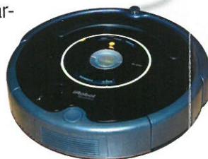
Beispiel eines Staubsaugerroboters

Vom Kleiderlift, über einen Kühlschrankalarm bis hin zum Staubsaugerroboter gibt es viel zu entdecken und auszuprobieren. Es werden überwiegend einfache technische Lösungsmöglichkeiten präsentiert, die hinsichtlich Anwendbarkeit und Finanzierung keine großen Hürden darstellen sollen.