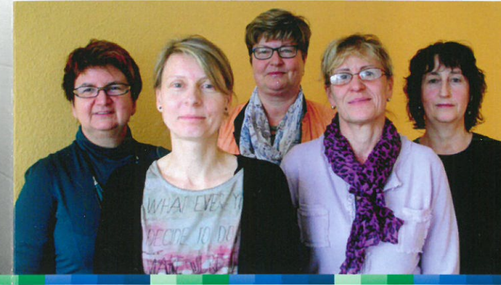
Ihre freundlichen Beraterinnen