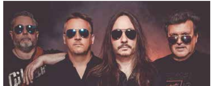
Rockcover von Cunnig Stuff